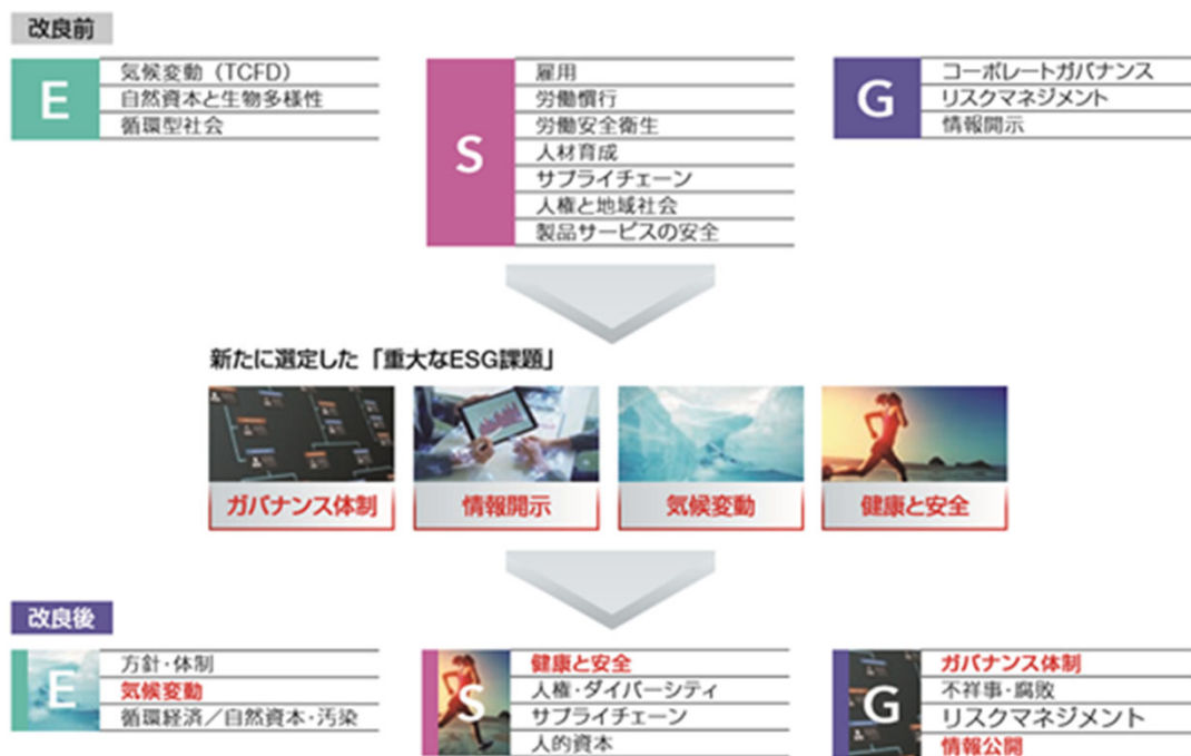
【図表2:運用資産への影響度やエンゲージメントの実効性における最も重大なESG課題の再評価】

また、大手機関投資家の三菱UFJ信託銀行は、2020年に最も重大なESG課題を再評価し、S(社会)を大きく改良、人的資本を組み入れています(図表2)。